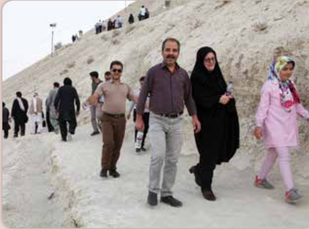
از همکاران از این تسهیلات بهره‌مند شوند زیرا وضعیت فعلی به گونه‌ای اقامتگاه‌های شمال و مشهد هم در دستور کار قرار گیرد تا طیف بیشتری

او می‌افزاید: چه رویدادی بهتر از اینکه در یک روز تعطیل خانواده‌ها دور هم جمع شده و فراغت خاطر به گردش، تفریح و فراغت خاطر بگذرانند. خوشبختانه ایجاد کانال شرکت در فضای مجازی باعث شده اطلاع‌رسانی برنامه‌ها گستره بیشتری از همکاران را در بر گیرد. دسترسی به اخبار و اطلاعات از طریق کانال آسان‌تر از پورتال است و همکاران ما در ساختمان‌های شرکت به صورت آنلاین از وقایع سازمان مطلع می‌شوند.